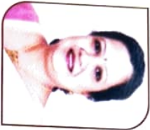
ਸ਼ੀਮਨੀ ਏਕਸ਼ਿਟੇਨ ਡੀ. ਜਵਦੇਸ਼ ਮਾ. ਯੈੱਓਡ ਮੇਨਲਿੰਗ ਡੀਕੋਟਰਜ਼