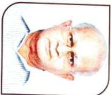
ਸ਼ੀ ਪਰਿਯਦੰਦ ਆਰ. ਨਾਯਕ ਮਾਨ. ਡੀਕੋਟਰਜ਼