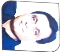
ਸ਼ੀ ਮਯੂਰ ਓ.ਸ. ਚੌਫਲਾ ਮਾਨ. ਚੇਟਮੇਨਸ਼ੀ