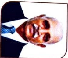
ਸ਼ੀ ਪਰਯਕਾਸ਼ ਕੁ. ਮਾਘਾਈ ਮਾਨ. ਡੀਕੋਟਰਜ਼